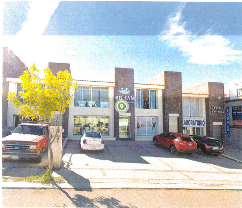
Ave. Las Cumbres No. 123, Colinas del Padre III